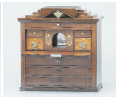
Schreibsekretär Modellmöbel, norddeutsch, Anf. 19. Jh.