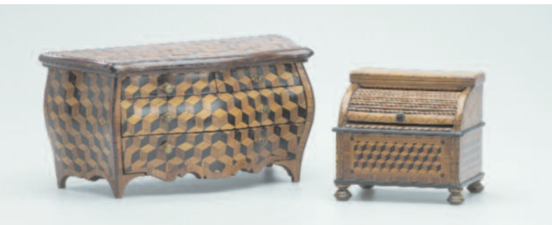
Barockkommode und Rollsekretär Modellmöbel, deutsch, Mitte 18. Jh.

Katalog zur Ausstellung: „Kostbar und geheimnisvoll – Miniaturmöbel und Schatzkästchen“, 64 Seiten, zahlreiche Farbabbildungen (10,- €)